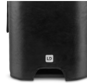
Speaker is not included