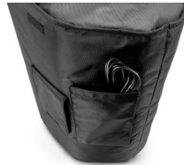
Cable is not included